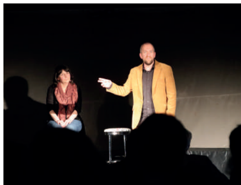
Cont'émoi «Pourvu qu'on ait l'ivresse», au CEC, 29 avril