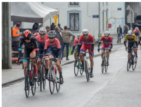
Grand Prix Ferdinand Bracke Le 22 avril 2023.