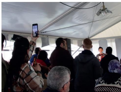
Qu'est-ce qu'on fête ? Concert de clôture, Vogenée, 23 avril