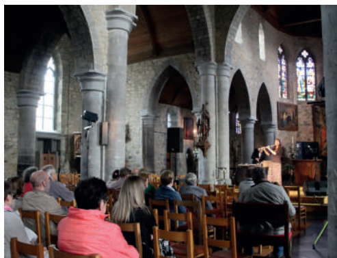
Les Zakoustic's, Wonky Clock, Yves-Gomezée, 14 mai