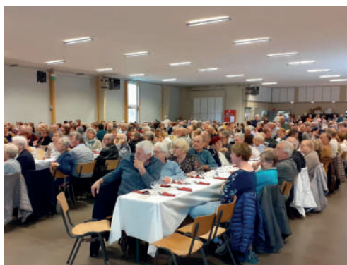
Traditionnel repas des Aînés de la Ville Le 16 mai 2023, la Silène (Silenrieux).