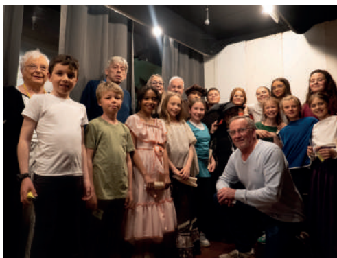
Théâtre intergénérationnel « Quelles histoires ! » - Les 6 et 7 mai 2023.