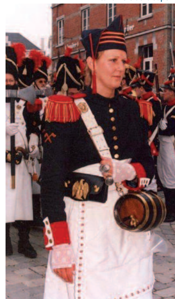
En cantinière de la Saperie